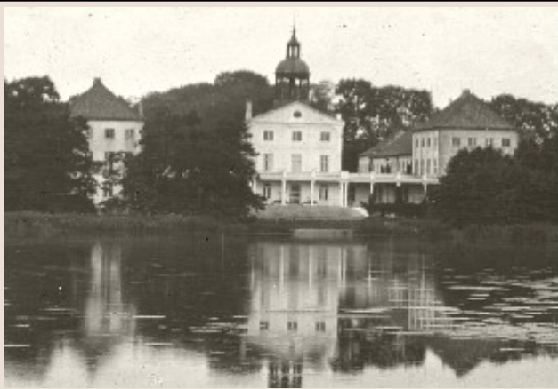
Gråsten Slot efter Ernst Günthers ombygning i 1908.