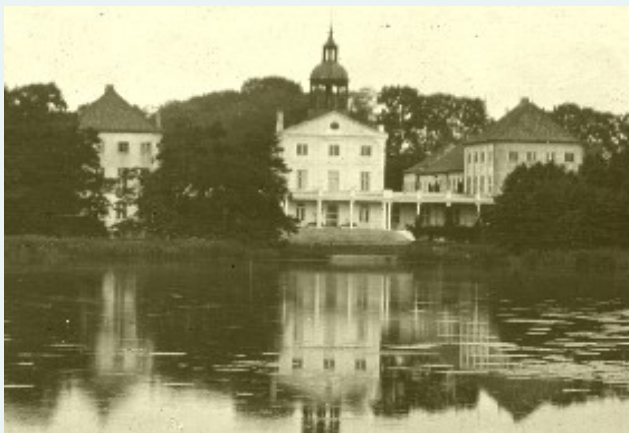
Gråsten Slot efter Ernst Günthers ombygning i 1908.